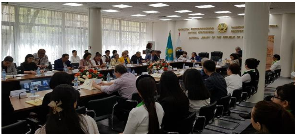
Халықаралық мәдениеттерді жақындастыру орталығының директоры О. О. Сүлейменов Еуразиялық экономикалық форум (Бішкек қ.) 26 мамыр 2022ж.