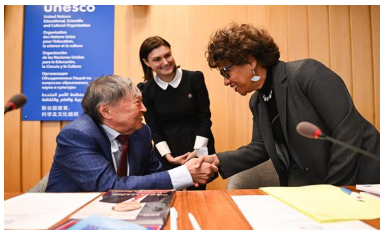
«Планетарлық сананың мәселелері: мәдениет және саналы өзара тәуелділік» Еуразия мәдениеттерін жақындастыруға бағытталғын V Халықаралық форум 26 қазан 2022 ж. (Алматы қ.)